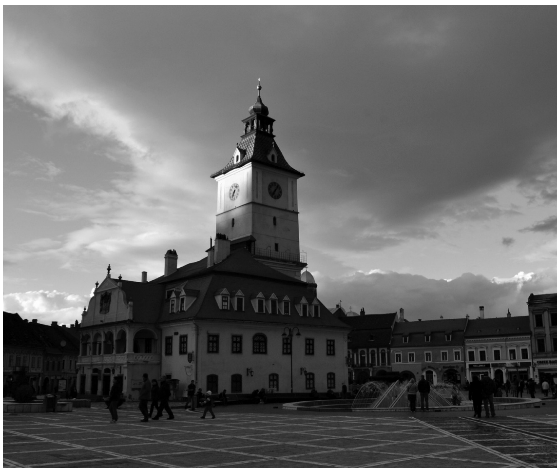
A Tanács tér