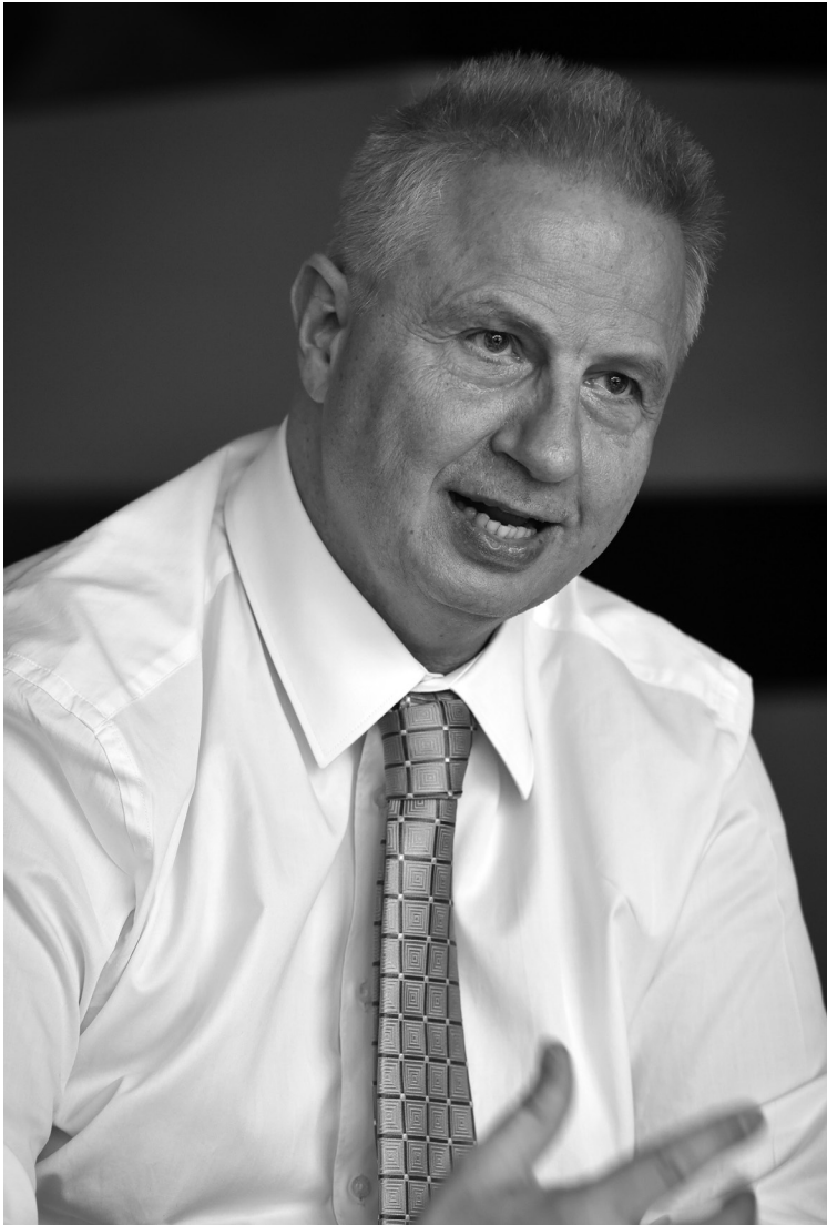
dr. Trócsányi László

tétlenül el kell mondanom, nagyon erős rejtett kohéziót lehetett érezni a magyarok körében. Az a dacos ellenállás, ami a Ceaușescu-időszakban volt, azt is jelentette, hogy az emberek, ha szabad így mondanom, szegények voltak. Nézzük meg az akkori és a mai kocsi parkot, vagy akkoriban a páros és páratlan hetet az autóhasználatban! De felidézhetjük emlékeinkből a bevásárlás nehézségeit, a boltok ürességét is akár. Mindez valamiféle nagyon erős belső tudatot, tartást adott az embereknek. A mai fogyasztói társadalomban a tartást elveszíti az ember. A történet egyszerűen arról szól mostanában, hogy mennyit is tudok fogyasztani: hány új autóm van, mennyiért vettem meg a telket, milyen öltönyt hordok, milyen cipőt viselek. Ezek külsőségek. Akkor még nem is igen tudták az emberek, hogy mik is azok a külsőségek. Viszont nagyon erősen integratív volt a magatartásuk. Közösségek alakultak ki, s ezek a közösségek nem kifele, hanem befele, nem extrovertáltak, hanem introvertáltak módon léteztek. Ezt én, mint hátizsákos turista éreztem akkor. És aztán idővel meg is nyíltak az emberek. Ahogy a beszélgetések elmélyültek, úgy lehetett egyre jobban érezni az emberek magyarságtudatának a fontosságát is.