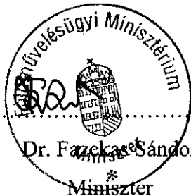
Dr. Fazekas Sándor Miniszter